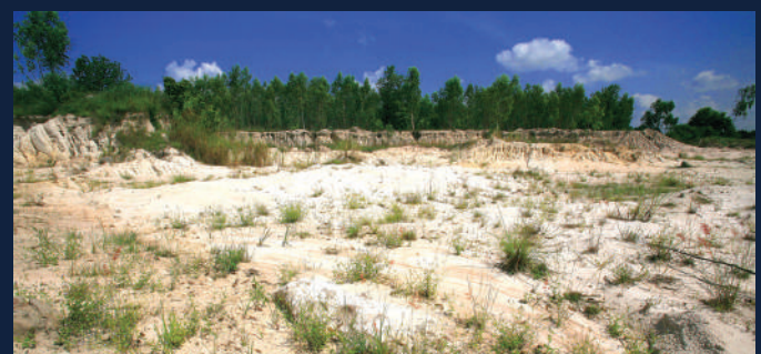
His Majesty the late King Bhumibol Adulyadej established the Pikun Thong Royal Development Center in Narathiwat to conduct innovative research into the process of soil acidification and to develop a way to improve the soil so that it would once again support crop production.