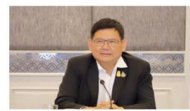
อว.ดึงใบตรวจแพทย์ ช่วยระบบกลางเรียนออนไลน์ คาดอีกเดือน "นศ.2ล้านคน" ได้เรียน

ทั้ง"พรรค-พรรค"สู้กัน เป้าเสียตาย... ปาถวน (๒๕ มี.ค.๖๓) พระสยบอริ พระปรีดย ชยรัตน์เป่ากัญพิบัติ วิชาเวทย์ประคอง "โต" "ถึงจุดเนบพทก็ยังไม่จบ" ที่สุด วิกฤตการณ์นี้ คือจบ โควิด-๑๙ "ทบทวน-สรุป" "ประเทศฯ แล้วไม่มีรัฐ" "รัฐจตุร" ที่ยังไม่พอสมา ภาพประวัติศาสตร์ "สยบโควิด"