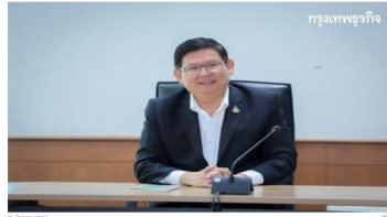
“สุรศักดิ์” สั่งกำชับบุคลากรทางการแพทย์ ควบคุมการเข้าถึงห้องฉุกเฉิน...