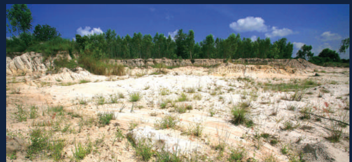
His Majesty the late King Bhumibol Adulyadej established the Pikun Thong Royal Development Center in Narathiwat to conduct innovative research into the process of soil acidification and to develop a way to improve the soil so that it would once again support crop production.